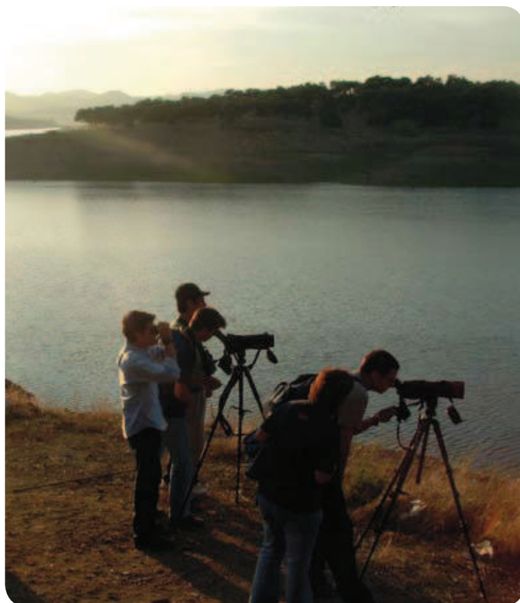
Observación de fauna en Hornachuelos

suelo calizo), entre las que destaca el culantro de pozo, un bello helecho al que se le han atribuido propiedades para el cuero cabelludo, de ahí también su denominación como cabello de Venus.