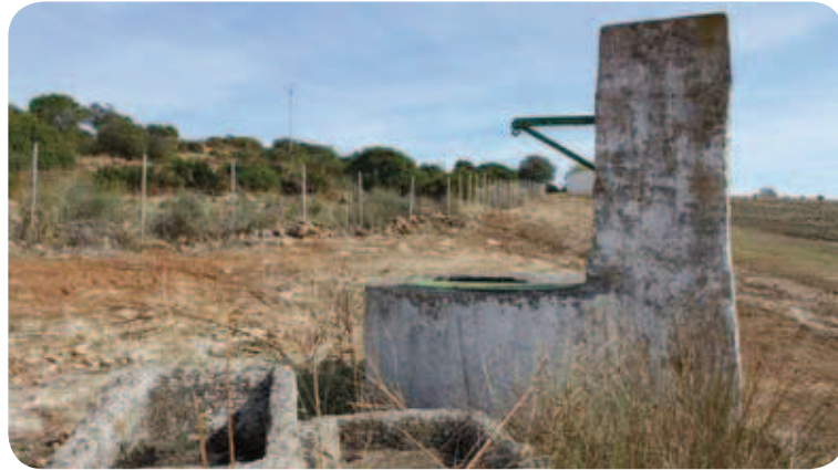
Pozo de Arbón

La Cañada Real Soriana enlaza con nuestro sendero procedente de la vega y nos acompaña, sirviendo de divisoria entre la falda de la sierra y los cultivos. Los ejemplares arbóreos de encina se van haciendo más numerosos y a un lado y a otro las paredes de piedra delimitan la anchura legal de la vía pecuaria. Acabamos de entrar en el término municipal de Posadas y aunque la mayoría de los cortijos que vamos pasando han sido rehabilitados, otros mantienen muretes, rediles y abrevaderos que delatan su origen pastoril.