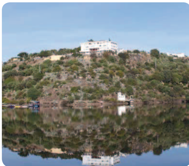
Presa de derivación del Bembézar

áreas incluye parte de los términos municipales de Almodóvar del Río, Hornachuelos, Posadas, Villaviciosa de Córdoba y una pequeña franja del término de Córdoba. Se encuentra incluido dentro del espacio "Reserva de la Biosfera Dehesas de Sierra Morena" lo que le otorga un interés natural de primer orden. Este espacio natural protegido cuenta con el Centro de Visitantes Huerta del Rey, muy cercano al pueblo, desde el que se pueden realizar una serie de itinerarios que nos muestran la belleza y magnitud del monte mediterráneo. Además de la riqueza biológica presente en los encinares y alguna mancha de alcornocal, en Hornachuelos se puede disfrutar de un itinerario junto a un cauce espléndido acompañado de una de las mejores alisedas de la provincia, el río Guadalora.